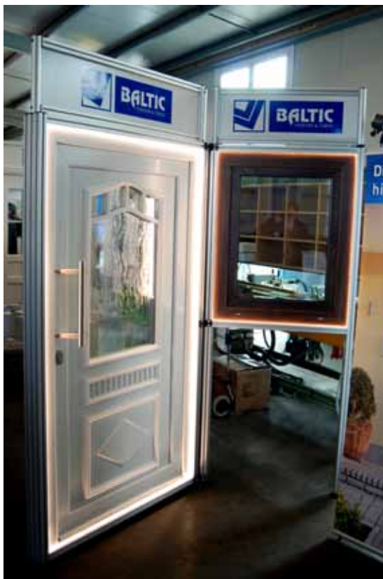
Messestand für eine Tür und zwei Fenster

Außerdem lassen sich die Stände durch jede Menge zusätzliche Features ergänzen. Prospektablagen, Halter für Tablet-PCs, Schilder mit Ihrem Logo oder eine integrierte LED-Beleuchtung sind nur einige Beispiele für die fast grenzenlosen Möglichkeiten unseres Systems.