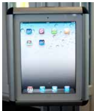
Diebstahlsicherer Halter für Tablet-PC für virtuelle Produktinformationen