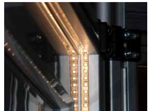
Integrierte LED-Streifen rücken Ihr Produkt ins "rechte Licht"